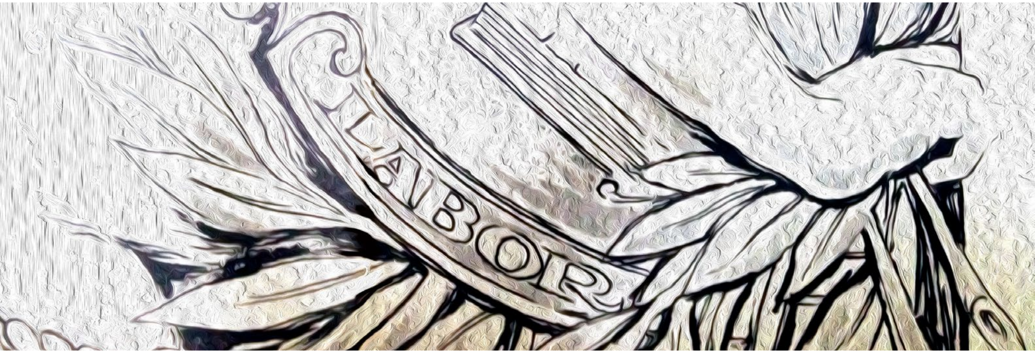
Ilustración adaptada de la Publicación "3 Vidas Paralelas" de el Profr. Gustavo Ramírez Padilla Mayo de 1976